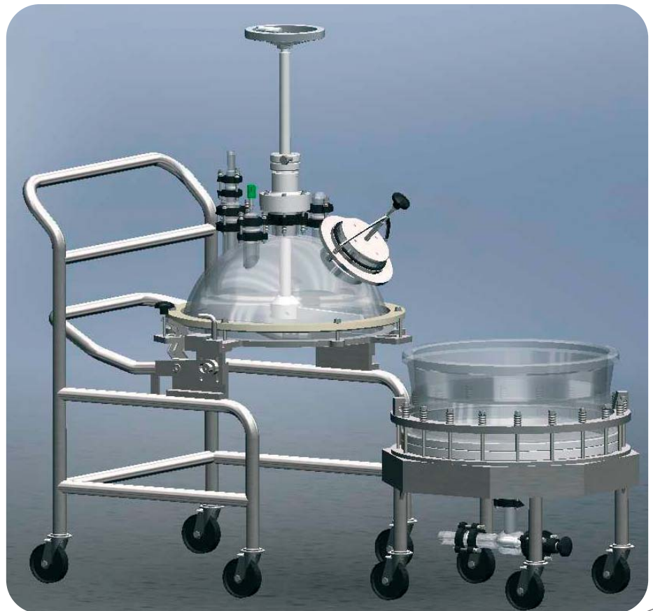
Abb. 3: QVF®-Filternutsche mit angehobener Haube und herausgefahrenem Gefäß.

05.09 P.165d.1, Änderungen vorbehalten. Copyright © De Dietrich Process Systems GmbH 2009.