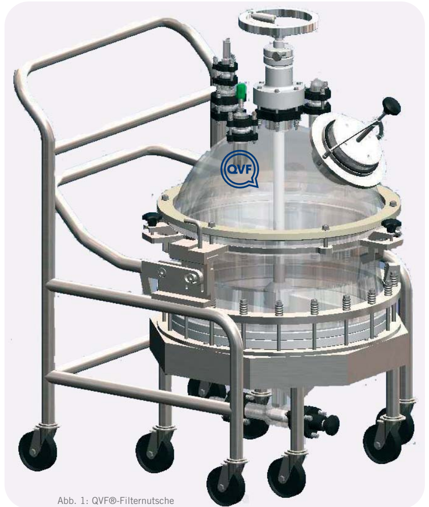
Abb. 1: QVF®-Filternutsche